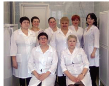
Коллектив микробиологической лаборатории