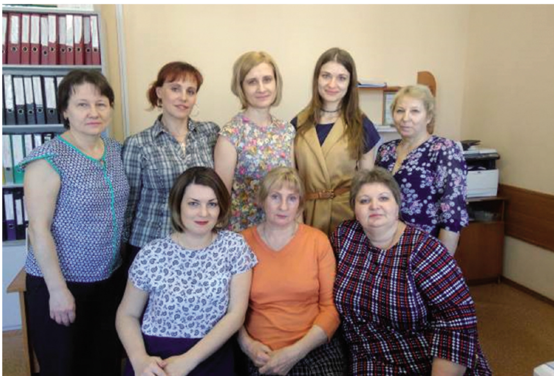
Работники санитарно-эпидемиологического отдела филиала в г.Лесосибирске