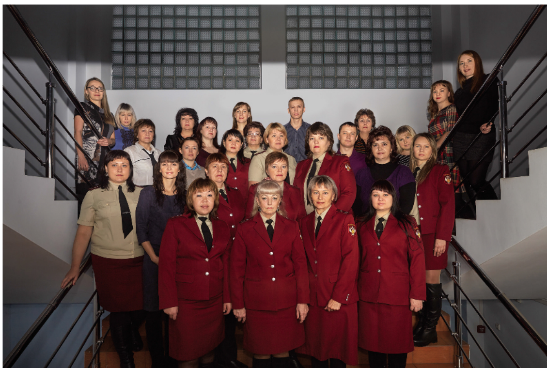
Коллектив территориального отдела в г. Минусинске, 2016 год.

На протяжении многих лет на поднадзорных территориях не регистрируются массовые инфекционные и неинфекционные заболевания (пищевые отравления), связанные с продукцией предприятий пищевой промышленности, общественного питания и торговли.