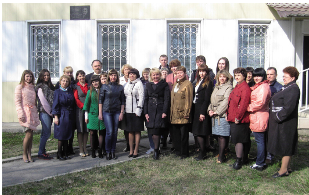
Коллектив территориального отдела Управления Роспотребнадзора по Красноярскому краю в г. Ачинске, 2016 год.