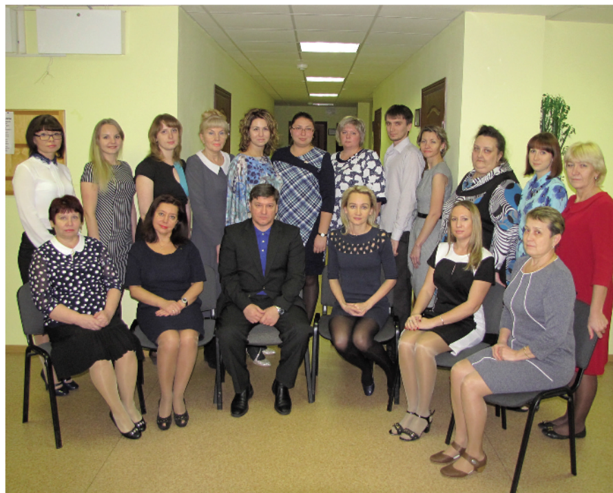
Коллектив территориального отдела Управления Роспотребнадзора по Красноярскому краю в г. Норильске.

В результате проводимого комплекса санитарно-противоэпидемиологических мероприятий в городе Норильске и Таймырском (Долгано-Ненецком) муниципальном районе не регистрируется среди детей заболеваемость полиомиелитом, дифтерией, снизилась заболеваемость острыми кишечными инфекциями, корью, коклюшем и скарлатиной.